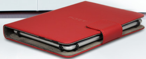
Elegant design imitation leather Design elegant simili cuir