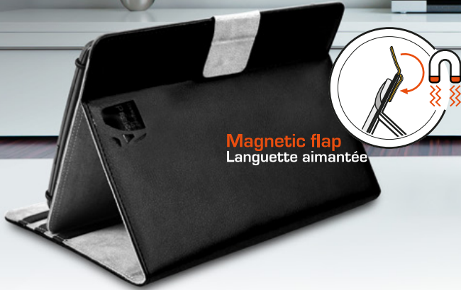
Magnetic flap Langouette aimantée